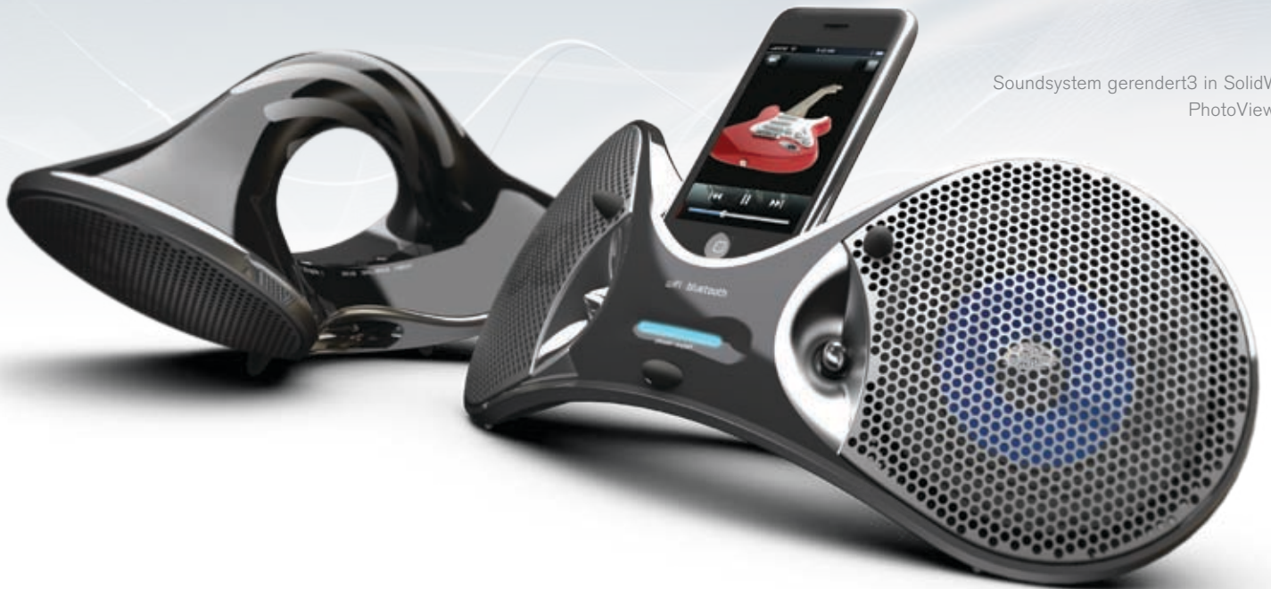
Soundsystem gerendert 3 in SolidWorks PhotoView 360

DIE KOMPLETTE 3D-CAD-LÖSUNG FÜR DIE KONSTRUKTION NOCH BESSERER PRODUKTE